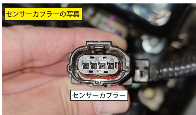
エアフロセンサーからセンサーカプラーを抜いて、カプラー部分のアップ写真。