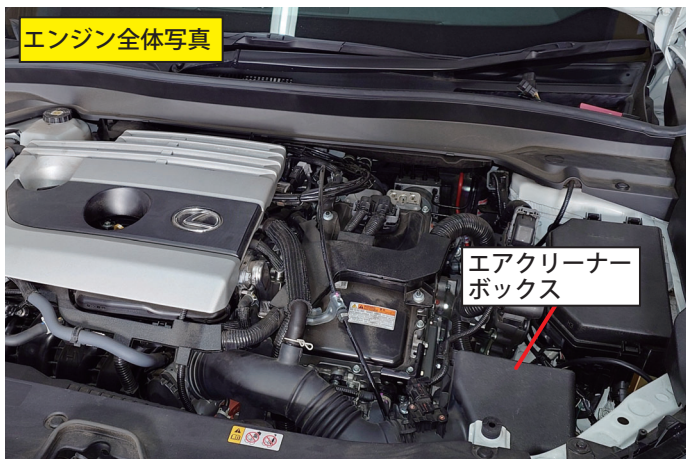
エアクリーナーボックス全体と配置が確認できる写真。

※エンジンをオフにしてもしばらくは待機状態となりECU、センサーの電源は切れません。電源が切れる前にセンサーからカプラーを抜くと信号断線と判断してエンジンチェックが点灯してしまいます。