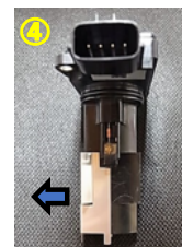
* 矢印はエンジン側