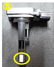
* 脱脂、テープ貼り付け