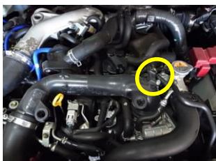
ニッサンジューク